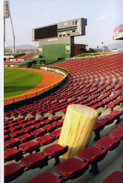
左/バー全景。古い球場の雰囲気を出すために、レンガタイルを貼り、エージング塗装を施している。左の擬岩に、めり込んだ様子を表現した直径900mmの巨大ボールはFRP製。上/球場の客席に飛び出したバット。右真/巨大バットのオブジェ。天井には旧広島市民球場をピッチャーマウンドから、魚眼レンズで撮影した円形の写真が貼られている。